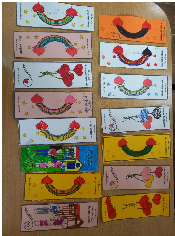
Elevii clasei a II-a A au realizat scrisori de mulțumire pentru profesorii clasei.